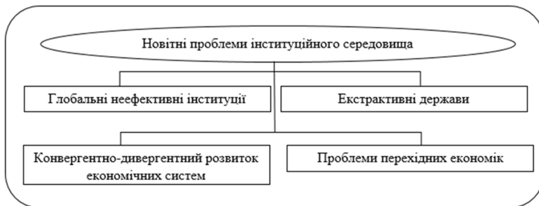
Рис. 2. Сучасні напрями досліджень неефективних інституцій

Цікавими в цьому контексті є також дослідження Д. Аджемоглу та Дж. Робінсон. Як відомо, з кінця XV ст. європейці колонізували більшу частину всієї земної кулі. Домінування Європи призвело до поступового нав'язування різних інституцій в різних куточках світу. Як зазначають автори, у великій кількості їхніх колоній, особливо в регіонах Африки, Центральної Америки, Карибського басейну та Південної Азії, європейські держави створили так звані «екстрактивні держави», бо свідомо не запроваджували особливого механізму захисту приватної власності, а також не забезпечили наявності необхідної системи перевірок і протипаг для уряду. Основною метою європейців в цих колоніях, на думку дослідників, був тільки видобуток їхніх ресурсів у тій чи іншій формі. Така стратегія колонізації та пов'язані з нею інституції дуже контрастують з іншими, які європейці створили в колоніях, де