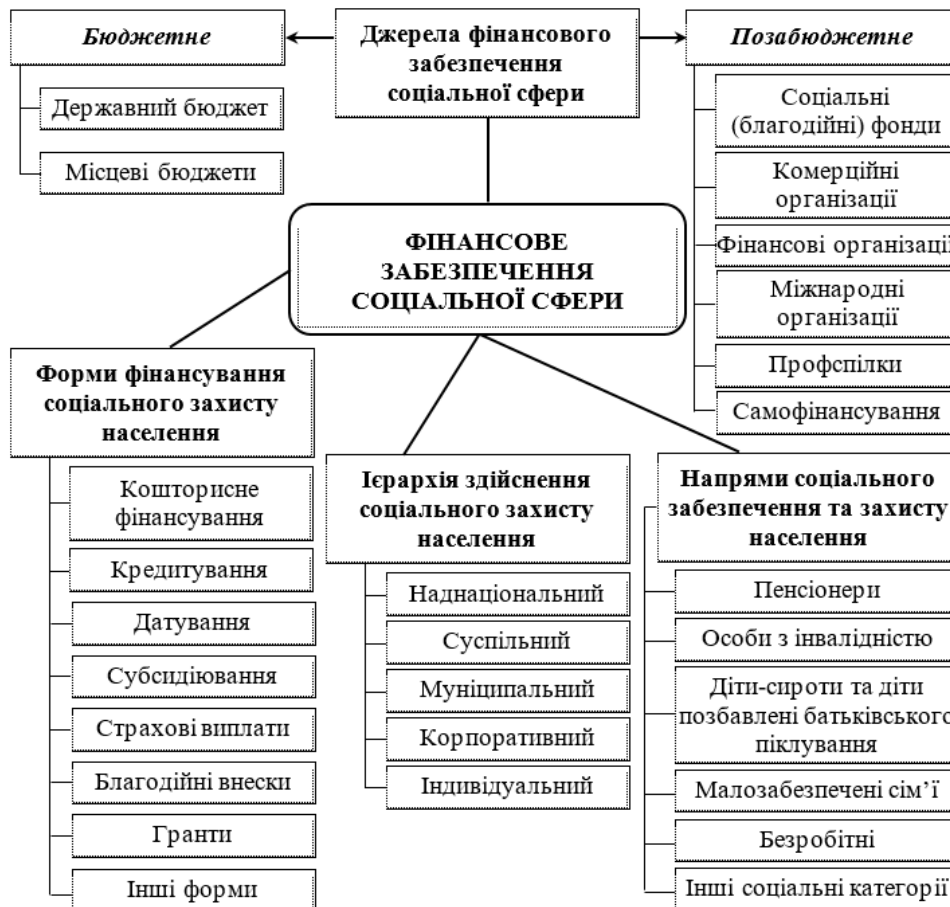
Рис. 1. Система фінансового забезпечення соціальної сфери України

Як бачимо, за досліджуваний період (з 2010-го по 2020 рік) видатки на соціальний захист та соціальне забезпечення населення, що здійснюється зі Зведеного бюджету України, зросли з позначки у 104534,9 млн грн у 2010-му році до 346720,5 млн грн у 2020 році або більш ніж у 3,3 рази. При цьому, вказані видатки у цілому по відношенню до розміру валового внутрішнього продукту (ВВП) за цей же проміжок часу залишались відносно стабільними і у середньому становили близько 8,9%, а максимального рівня