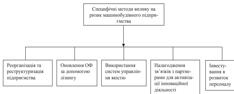
Рис. 2. Специфічні методи впливу на ризик машинобудівного підприємства

Методи, пов'язані зі специфікою окремих видів ризику, слугують для управління валютними, інформаційними, кадровими та іншими видами ризиків, враховуючи особливості даних видів ризику. Приклади такої класифікації представлені у таблиці 3.